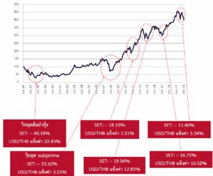
SET Total Return Index (1997- 2018)

*ไม่ได้ป้องกันความเสี่ยงทางด้านอัตราแลกเปลี่ยน